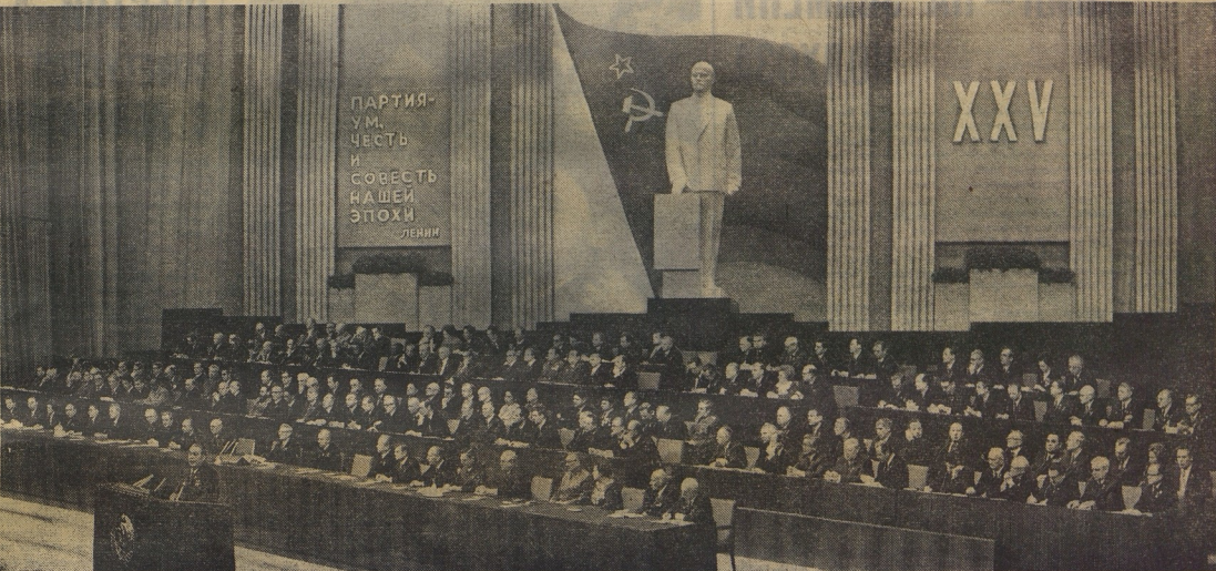
КРЕМЛЕВСКИИ ДВОРЕЦЪ СЪЕЗДОВ. На трибуне — Генеральный секретарь ЦК КПСС товарищ Л. И. БРЕЖНЕВ.

{6016} Год издания 51-й. Пятница, 27 февраля 1976 г. Цена 1 коп.